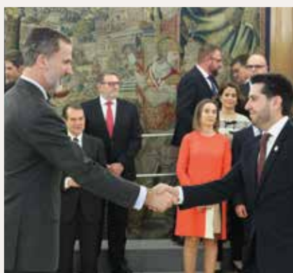
Javier García Ibáñez, Alcalde de Arnedo.