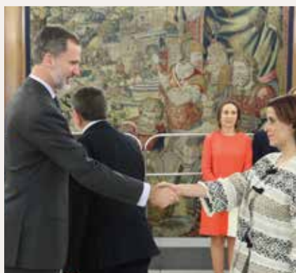
Enma Buj, Alcaldesa de Teruel.