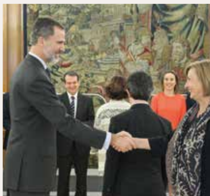
Mariví Monteserín, Alcaldesa de Avilés.