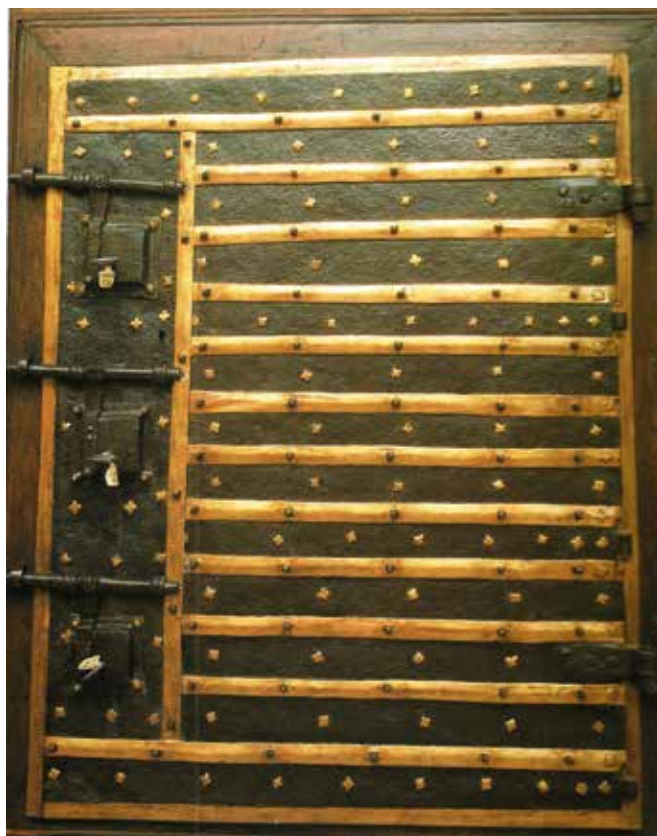
Archivo Pamplona. Arca tres llaves, 1423.

De los escritos de Tito Livio y de Salustio parece desprenderse que Pompeyo, después de combatir contra Sertorio en territorio numantino