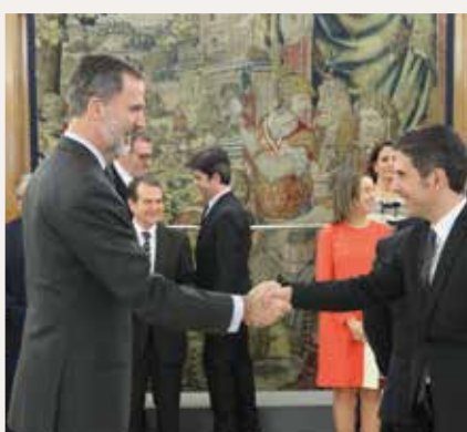
Javier Rodríguez, Alcalde de Alcalá de Henares.