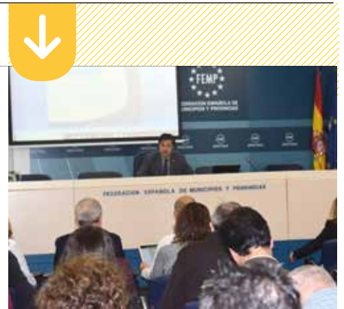
La Guía fue presentada en la sede de la FEMP.

El Esquema Nacional de Seguridad crea las condiciones necesarias para generar confianza en el uso de los medios electrónicos y dotar de seguridad a los sistemas, datos, comunicaciones y servicios electrónicos. Entre los sistemas que entran dentro de su ámbito de aplicación figuran la tramitación de expedientes, el padrón municipal, el portal de transparencia o la sede electrónica. Están sujetos al cumplimiento del ENS los Ayuntamientos, Diputaciones, empresas públicas u organismos autónomos.