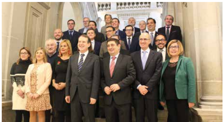
Los miembros de la Comisión de Diputaciones, Cabildos y Consejos Insulares y el Presidente de la FEMP.

Iglesias también aludió al orgullo de las Administraciones Locales por haber contribuido de manera significativa a compensar las cuentas públicas en los peores momentos de la crisis. Ahora, aseguró, es ya momento de flexibilizar para “contribuir con nuestros ahorros al bienestar de las personas”.