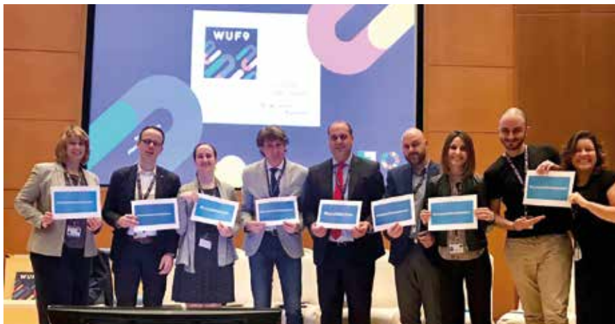
Participantes en la sesión que organizó la FEMP.

manifiesto que la alianza entre territorios es “esencial para que nuestra voz sea más fuerte” y recordó que la Agenda Urbana 2030 es una propuesta de cooperación y de desarrollo que también debe servir para caminar hacia la colaboración y el equilibrio entre las zonas urbanas y las rurales.