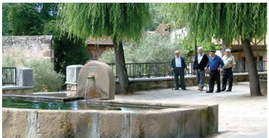
El mayor envejecimiento de las poblaciones rurales genera un problema de dependencia superior al del conjunto de la población española.

El CES aconseja al Gobierno que tenga en cuenta las medidas de la FEMP en materia de despoblación