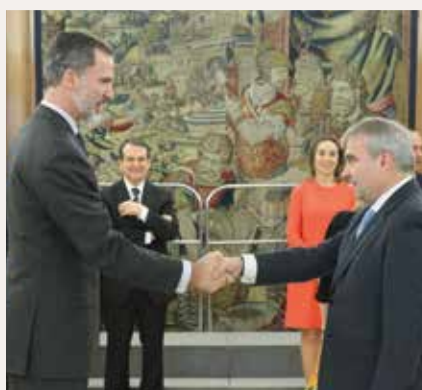
Francisco Javier Fragoso, Alcalde de Badajoz.