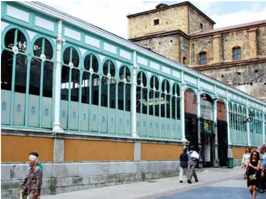
Mercado de Oviedo.

nificación o dotación de soluciones técnicas que aporta la idea y, por último, la eventual aplicabilidad y adaptabilidad de las ideas en los negocios comerciales.