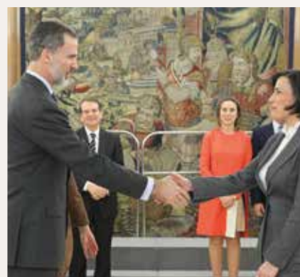
Gema Igual, Alcaldesa de Santander.