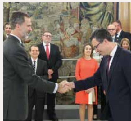
Francisco Ballesta, Alcalde de Murcia.