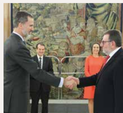
Jesús Ros, Alcalde de Torrent.