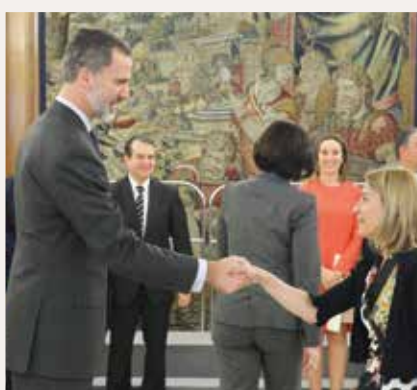
Elena Nevado, Alcaldesa de Cáceres.