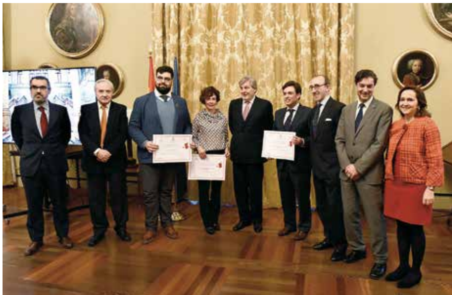
Los galardonados y los promotores, tras la entrega de los premios.