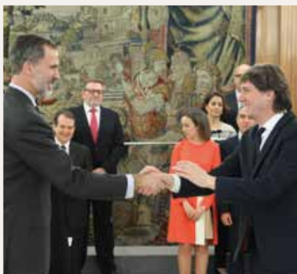
Carlos Martínez, Alcalde de Soria.