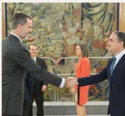
Elías Bendodo, Presidente de la Diputación de Málaga.