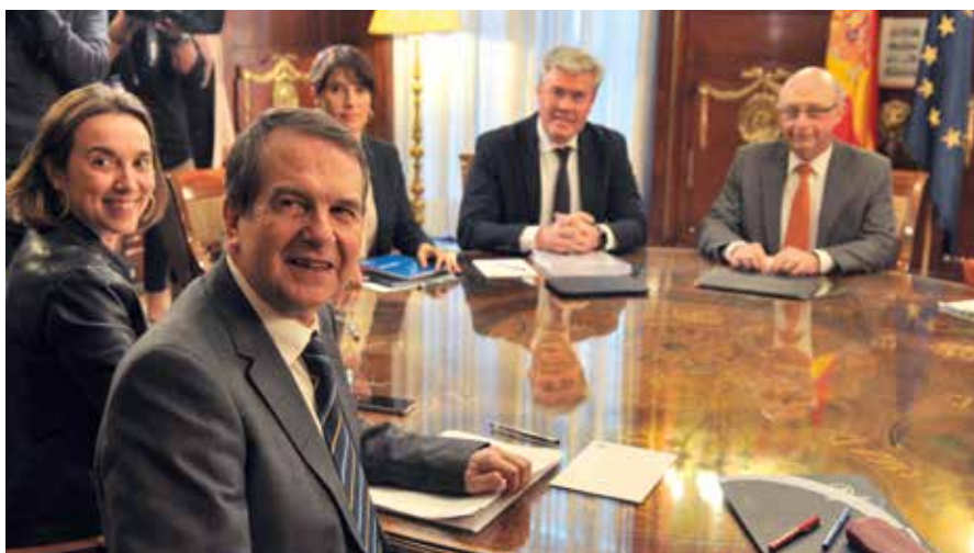
La reunión con el Ministro Montoro se celebró el 26 de febrero.

Tras la intervención del Presidente, y en el marco del carácter excepcional y único de la cumbre (a la que fueron convocados los miembros de la Junta de Gobierno y el Consejo Territorial de la FEMP, los miembros de los órganos de gobierno de las Federaciones Territoriales de Municipios y Provincias, Presidentes de Diputaciones, cabildos y Consejos Insulares y Alcaldes de municipios con más de 50.000 habitantes), los asistentes manifestaron sus propuestas y opiniones. De todas ellas, se desprendió un apoyo unánime del que damos cuenta en las páginas siguientes.