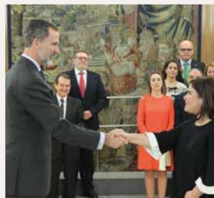
Concepción Brito, Alcaldesa de Candelario.