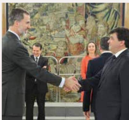
Gabriel Cruz, Alcalde de Huelva.