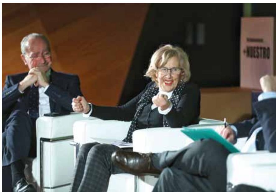
La Jornada se celebró en el Palacio de Cibeles de Madrid.

Carmena: “Es muy necesario que los Ayuntamientos sean la Administración más útil, más cercana y más nuestra”