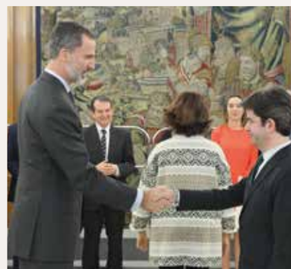
Luis Felipe, Alcalde de Huesca.